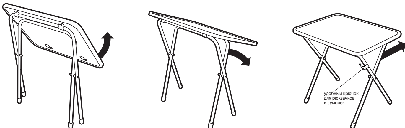
Рис.2 Схема раскладывания стола