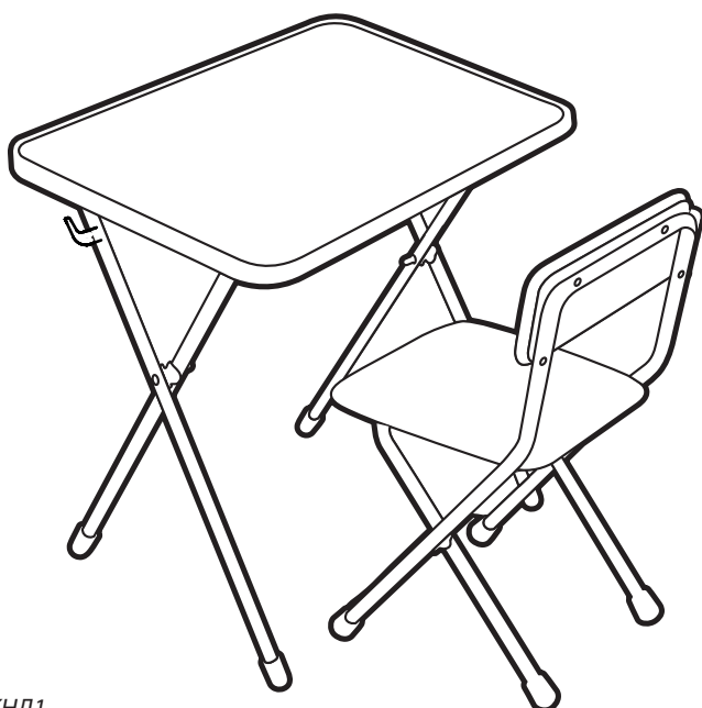
Рис.1 арт. КНД1

Перед эксплуатацией следует ознакомиться с паспортом и руководством по эксплуатации. Следуя инструкции, выполните установку стола и стула.