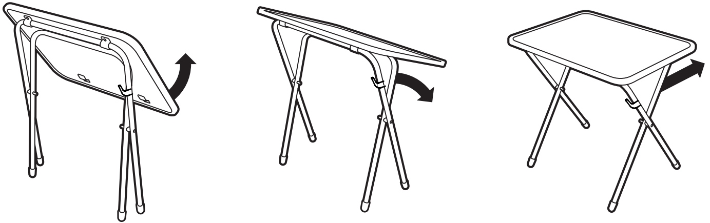
Рис.2 Схема раскладывания стола.

подпись ответственного лица, штамп торгующей организации