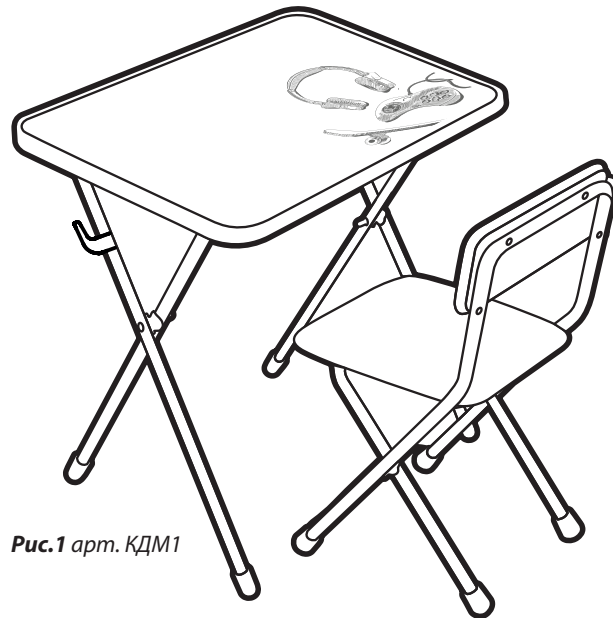
Рис.1 арт. КДМ1

Перед эксплуатацией следует ознакомиться с паспортом и руководством по эксплуатации. Следуя инструкции, выполните установку стола и стула.